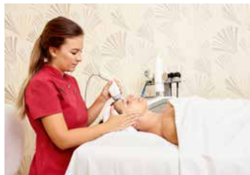
Radiofrequenz: Lifting ohne Chemie, ohne Skalpell (oben). – Auch Yoga gibt Kraft und macht jünger – und wie! (re.).

Mehr: Der Steirerhof, 08000-311412 (zum Nulltarif), +43-3333-3211-0, www.dersteirerhof.at und relax-guide.com